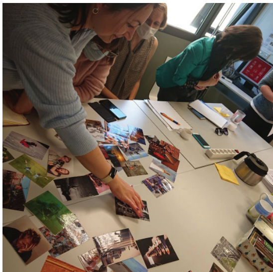
La Biblioteca Universitară Éducation Lyon- Croix-Rousse

domeniile de cunoaștere prin abordarea de gen, cu axe puternice: educație, sociologie, istorie și psihologie [1]. Această colecție răspunde unei misiuni fundamentale a sistemului de învățământ din Franța și anume sensibilizarea populației la stereotipurile sexiste, combaterea homofobiei, educarea despre sexualitate și sprijinirea predării cu privire la problema egalității de gen.