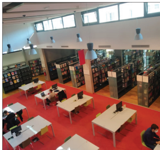
Sala de lectură din Biblioteca Universitară Éducation Lyon-Croix-Rousse

O altă locație vizitată de către bibliotecari a fost și Catedrala Notre-Dame de Fourvière - o biserică care a fost construită din fonduri private între anii 1872 și 1896. Biserica Fourvière este dedicată Fecioarei Maria, căreia i se atribuie salvarea orașului Lyon de ciuma bubonică care a cuprins Europa în 1643. În fiecare an, la începutul pe 8 decembrie, Lyon mulțumește Fecioarei Maria pentru salvarea orașului aprinzând lumânări în tot orașul, în cadrul Festivalu-