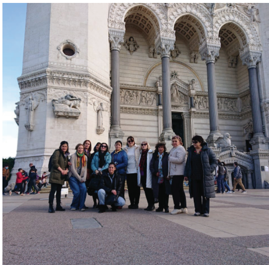
Echipa de bibliotecari moldoveni în fața Catedralei Notre Dame de Fourvière

pentru ABRM în cadrul Programului de dezvoltare al comunităților.