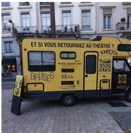
Mesaj motivațional de invitație la Théâtre des Célestins din Lyon