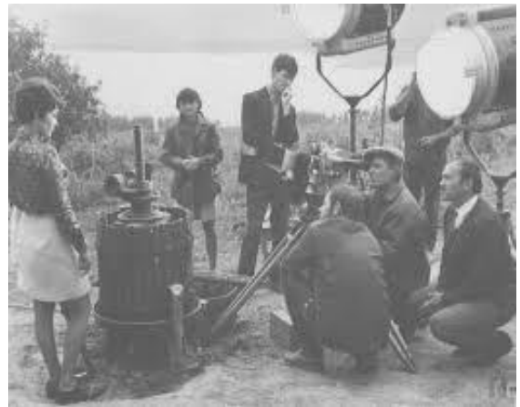
În rolul lui Obadă din filmul „Singur în fața dragostei” (1969; reg.: Gheorghe Vodă; scen.: Aureliu Busuioc, Gheorghe Vodă)