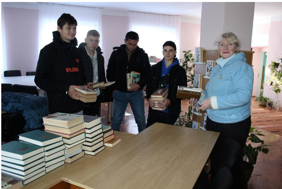
Proiect Instituțional „Donează o carte” are continuitate.

https://www.facebook.com/photo?fbid=519381476888064&set=pcb.519424916883720