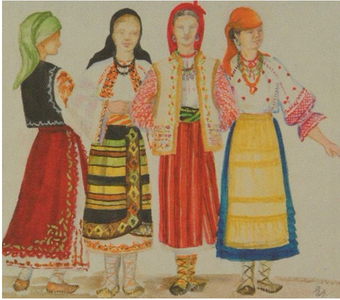
Schițe de costume pentru dansul-scenetă Cumetrii . 1953