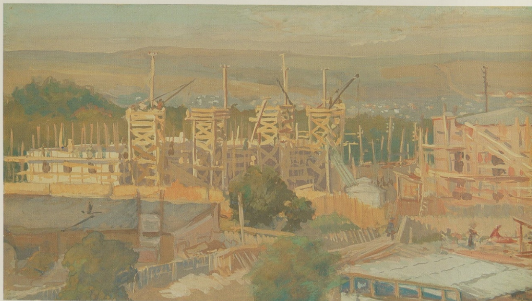
Construcții. Din ciclul «Restaurarea Chișinăului». 1947. Carton, guașă. 38,5 x 61,2 Muzeul Național de Artă al Moldovei Строительство. Из серии «Восстановление Кишинева». 1947. Картон, гуашь. 38,5 x 61,2 Национальный художественный музей Молдовы