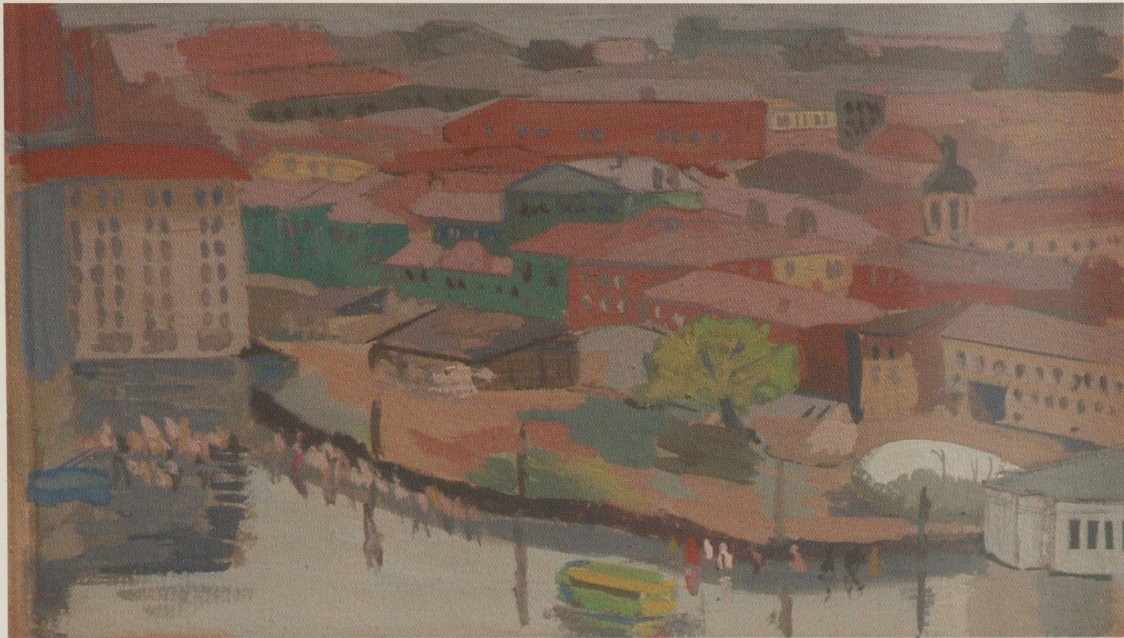
Moscova. 1943. Carton, guașă. 20 x 29 Москва. 1943. Картон, гуашь. 20 x 29