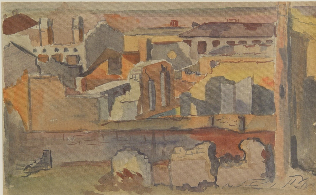
Ruinele orașului. 1944. Carton, guașă, acuarelă, creion. 29 x 40 Arhiva Națională a Republicii Moldova Руины города. 1944. Картон, гуашь, акварель, карандаш. 29 x 40 Национальный архив Республики Молдова