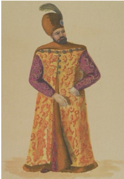
Schiță la costumul domnitorului Vasile Lupu. 1943