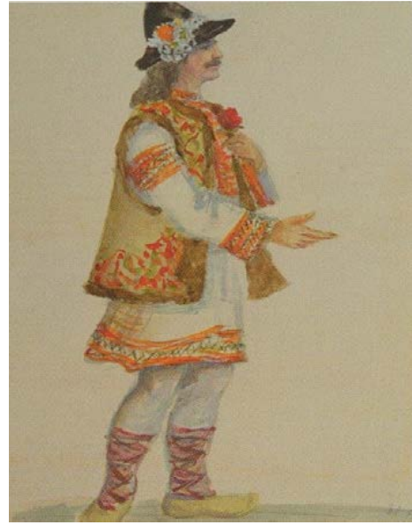
Schiță la un costum popular moldovenesc. 1954