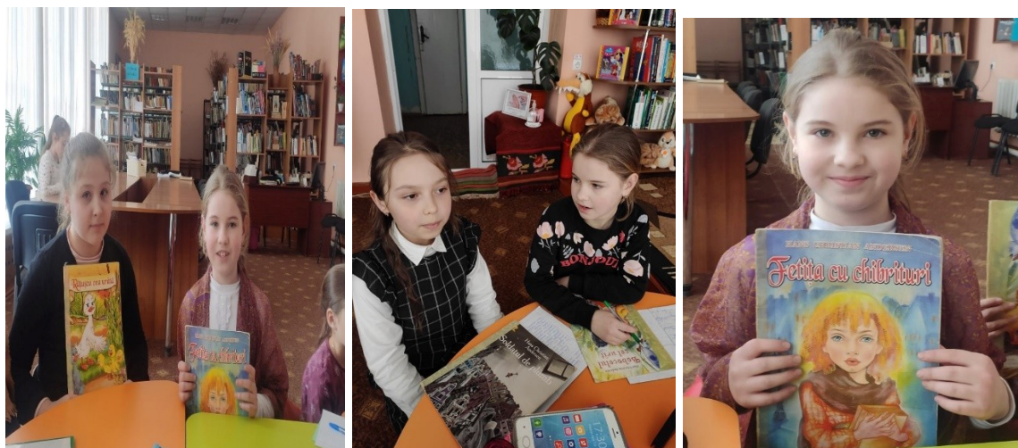
Serviciul modern de bibliotecă ” Readucem zimbetul pe fețele copiilor ”, ” Consiliere psihologică ”