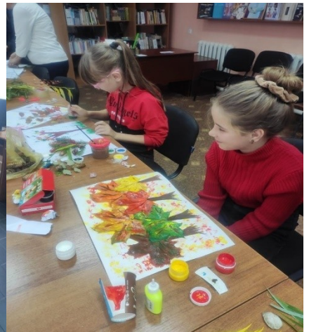
Serviciul modern de bibliotecă "Tema pentru acasa", "Pregătim temele la bibliotecă