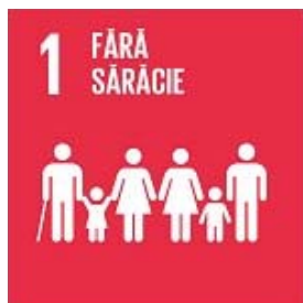
ODD nr. 1 „Fără sărăcie”

Bibliotecile susțin acest obiectiv prin furnizarea: accesului publicului la informații și resurse care oferă oamenilor oportunități de a-și îmbunătăți viața; instruirilor orientate pentru dezvoltarea competențelor de angajare în câmpul muncii; informațiilor pentru a sprijini procesul de luare a deciziilor de către guvernare, societatea civilă și economică prin combaterea sărăciei. În acest obiectiv se încadrează și serviciul de eGuvernare „Ajutor la Contor”, în prestarea căruia au fost implicate toate bibliotecile din raionul Hâncești. Programul „Ajutor la contor” a fost lansat în octombrie 2022, pentru a diminua impactul creșterii tarifelor la resursele energetice. 43 de biblioteci din rețeaua Hâncești au oferit acest serviciu, care se înscrie în ODD nr. 1 „Fără sărăcie”. Drept impact, 6.320 de persoane au beneficiat de asistență în vederea îndeplinirii cererii pentru înregistrarea pe platforma compensatii.gov.md.