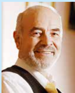
Iurie COLESNIC, Maestru al Literaturii

Cu mulți, mulți ani în urmă un cărturar care a fost cronicarul Miron Costin a descoperit că „Nu iese o mai dulce zăbavă decât cetitul cărților”. Și spusa lui s-a confirmat perfect până în mileniul trei, când au apărut ispitele tehnologice performante și locul cărții a început să fie substituit de cartea electronică, de rețelele de socializare. Și omenirea, făcând statistica după cărțile împrumutate la biblioteci sau cumpărate în librării, a ajuns la concluzia că contemporanul nostru citește mai puțin în comparație cu generațiile precedente.