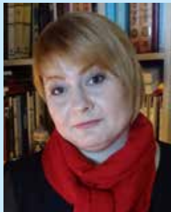
Maria PILCHIN, scriitoare, critic literar, publicistă, cercetătoare

Ziua Națională a Lecturii este o sărbătoare necesară, doar că utilitatea ei este, în primul rând, una de aducere aminte, e o zi, un prilej de a ieși în spațiul public și de a trage alarma, de a aminti faptul că lectura nu trebuie să aibă o dimensiune festivă, ci una rutinară, de zi cu zi. Căci lectura e o nevoie zilnică și anume această nevoie trebuie sărbătorită de Ziua Națională a Lecturii, nu procesul în sine, care se produce tot anul.