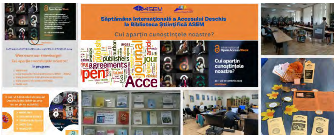
Secvențe din cadrul activităților organizate de BȘ ASEM

De-a lungul întregii săptămâni, bibliotecarii BȘ ASEM au demonstrat că accesul deschis reprezintă o oportunitate valoroasă de a conecta inițiativele globale de schimb liber al cunoștințelor cu adoptarea unor politici favorabile și cu abordarea problemelor sociale care influențează viața oamenilor din întreaga lume. Evenimentele organizate au oferit un cadru propice dialogului și cooperării, facilitând apropierea comunității academice de valorile accesului deschis, promovând conceptul de știință deschisă , încurajând utilizarea eficientă a resurselor electronice și sprijinind diseminarea rezultatelor activității de cercetare.